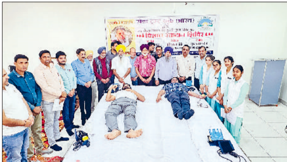
बराड़ा। रक्तदानियों को सम्मानित करते हुए मुख्यातिथि व अन्य।

रक्तदान से न केवल दूसरों की जान बचाई जा सकती है, बल्कि यह शरीर और मन दोनों के लिए लाभदायक है