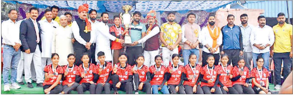
पानीपत। हरियाणा लेक्रोस महिला व पुरुष चैपियनशिप के विजेताओं को पुरस्कृत करते अतिथिगण।