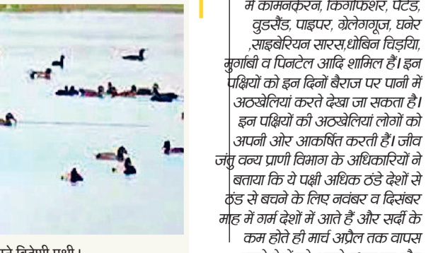
यमुनानगर के हथनीकुंड बैराज में पानी में विचरते विदेशी पक्षी।