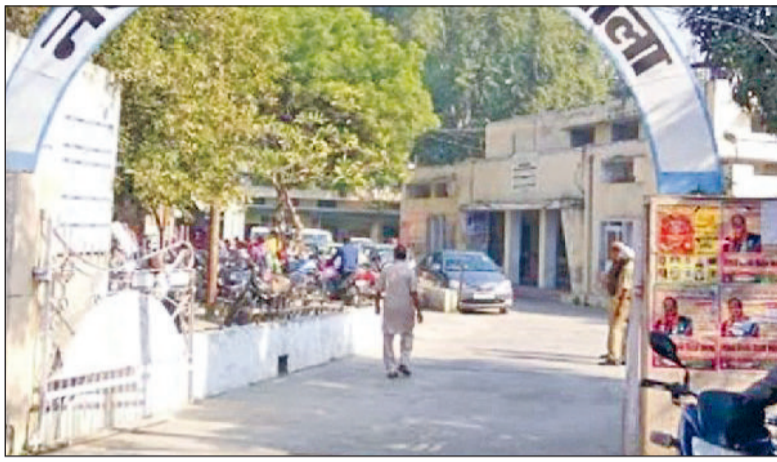
अंबाला। नगर निगम का बाहरी दृश्य।