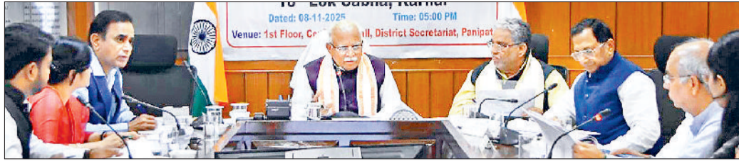
पानीपत। केंद्रीय मंत्री मनोहर लाल, दिशा बैठक की अध्यक्षता करते हुए।